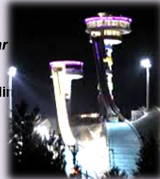
Erzurum Ski Jumping Towers