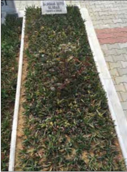
Resim 6. Zincirlikuyu'daki mezarından bir görünüm.

çalışmalarını "Bursa ve Uludağ (1928)" ve "Bursa Kumaşları" adlı iki inceleme kitabında ve 1936 yılında yayınladığı "Uludağ: Tapınakları, Dervişleri, Keşişleri" başlıklı makalede toplamıştır. Ayrıca, "Yeşil Cami" adlı bir kitabı da bulunmaktadır.