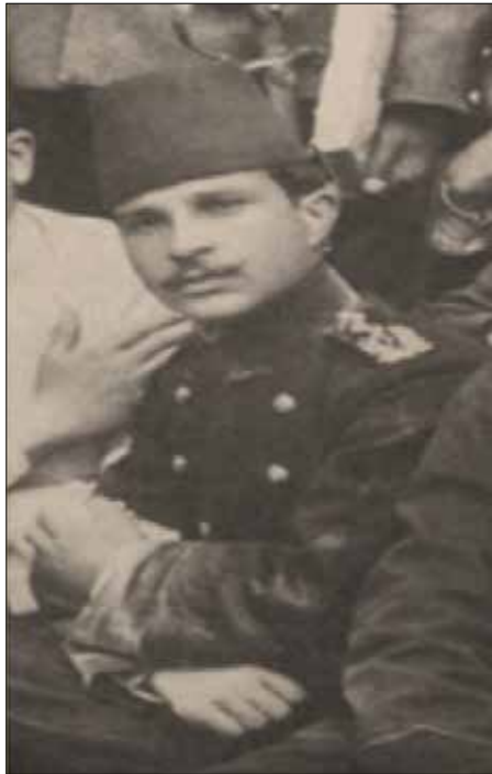
Resim 2. Osman Şevki Uludağ Tıbbiyede.

Daha sonra iki dönem daha aynı şehirden milletvekili seçilerek toplam üç dönem (V, VI ve VII. dönemler) milletvekilliği yapmış, bu sürede özellikle Konya ve dolaylı ile yakından ilgilenecek şehrin imar ve tanziminde, hayvan ve ziraat hastalıkları mücadelesinde başarılı çalışmalar yapmıştır. Ayrıca milletvekilliği sırasında Sıhhat ve İçtimai Muavenet Encümeni (Sağlık ve Sosyal Yardım Komisyonu) daimi üyesi yapmış olup, özellikle sağlıkla ilgili birçok kanun teklifinde de imzası bulunmaktadır.