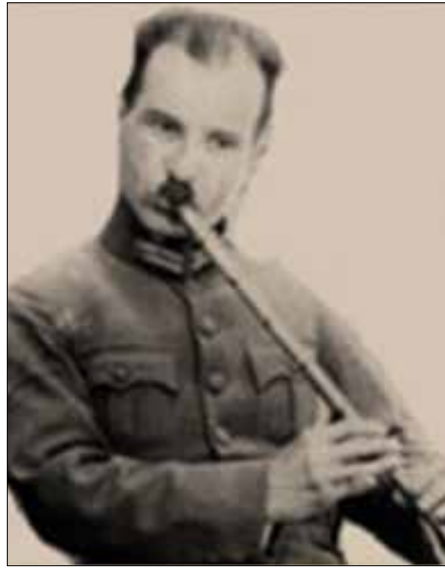
Resim 4. Neyzen Osman Şevki.

Daha sonra iki dönem daha aynı şehirden milletvekili seçilerek toplam üç dönem (V, VI ve VII. dönemler) milletvekilliği yapmış, bu sürede özellikle Konya ve dolaylı ile yakından ilgilenecek şehrin imar ve tanziminde, hayvan ve ziraat hastalıkları mücadelesinde başarılı çalışmalar yapmıştır. Ayrıca milletvekilliği sırasında Sıhhat ve İçtimai Muavenet Encümeni (Sağlık ve Sosyal Yardım Komisyonu) daimi üyesi yapmış olup, özellikle sağlıkla ilgili birçok kanun teklifinde de imzası bulunmaktadır.